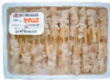
業務用アキレス(25g)40本入