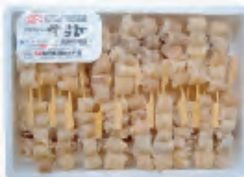
業務用牛すじ(25g)40本入