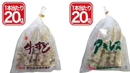
牛すじ (20g) 10本袋 アキレス (20g) 10本袋

売り場でパッと目を引く袋入りの商品です。1本20gの牛すじ、アキレスをそれぞれ10本ずつ詰め合わせております。