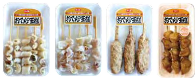
牛すじ (20g) アキレス串 (20g) つくね串

専用ラベルを使用して、単品ではなくシリーズによる棚割が可能な畜肉おでん種です。牛すじ、アキレス、つくね串に加え、焼き鳥で人気のぼんじり串をラインナップしております。